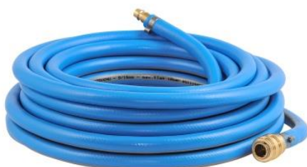
hadice s rychlospojkou A83131014 - 13x19 mm, 10 m 806,- Kč A83091014 - 9x15 mm, 10 m 539,- Kč