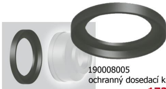
190008005 ochranný dosedací kroužek 172,- Kč