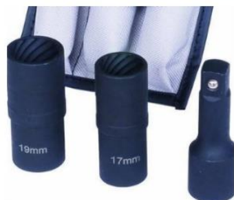
8006733 sada pro demontáž bezpečnostních šroubů 17 a 19 mm 3.066,- Kč