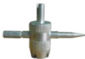
5628009/235020 závitník na ventilký 98,- Kč