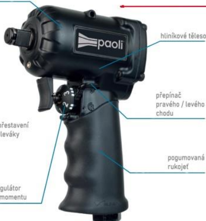
A1050 pneumatický utahovák Paoli 1/2", 700 Nm 5.220,- Kč

jednoduché přestavení ovládání pro leváky