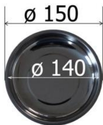
MISKA magnetická miska průměr 150 mm 229,- Kč