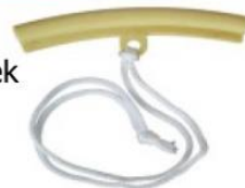
5180396 ochranný půlměsíc na ráfek 204,- Kč