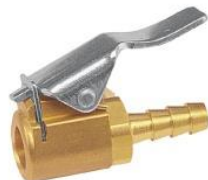
hustící koncovka s klipem 5625105/143000 - 6x14 mm 100,- Kč 5625095/143100 - 8x14 mm 92,- Kč