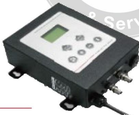
90262050 hustící automat závěsný 230V 2 paměťová místa 7.776,- Kč