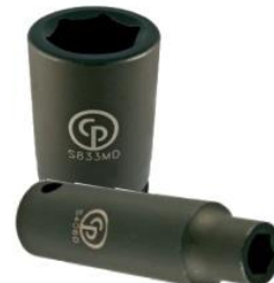
utahovací ořech kovaný 1/2" CP8940164007 - 17L 311,- Kč CP8940164009 - 19L 358,- Kč CP8940164010 - 21L 398,- Kč