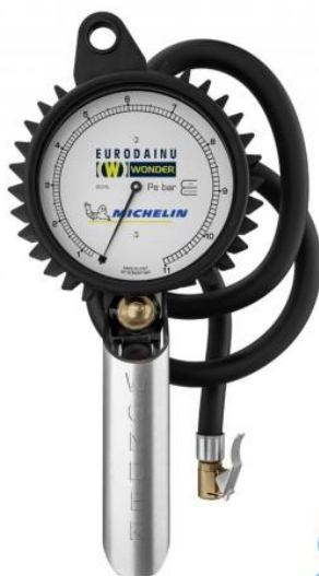
5199356 hustící pistole EURODAINU do 12 bar 2.069,- Kč