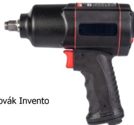
PX23 pneumatický utahovák Invento 1/2", 1600 Nm 2.360,- Kč