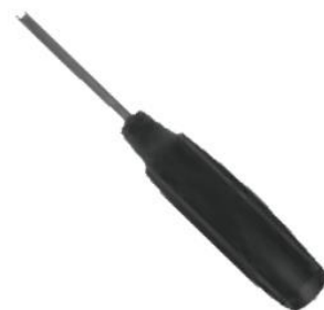
5623960 šroubovák na ventilký, momentový 154,- Kč