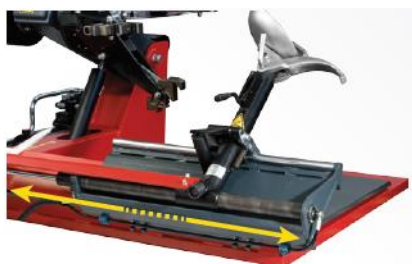
Hydraulický posuv nástrojového suportu