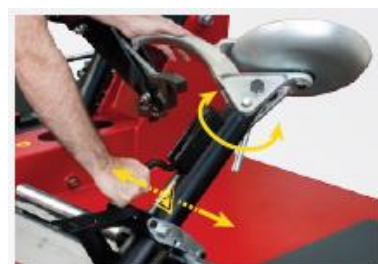
Manuální odklápění a otáčení nástrojové hlavy