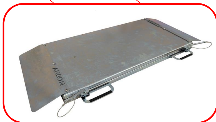
Zadní plovoucí desky