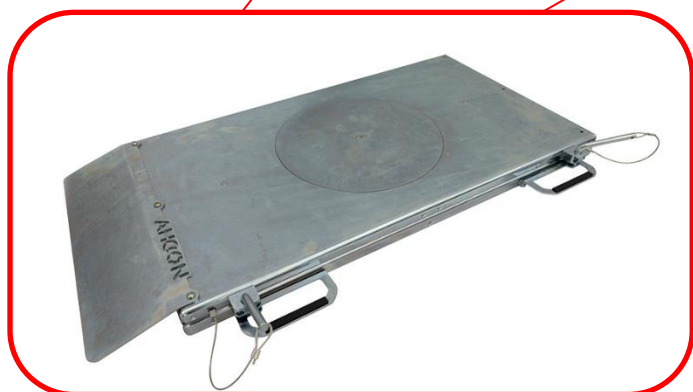
Přední otočné a plovoucí desky – bez nutnosti použití přejezdových plastů (!!)